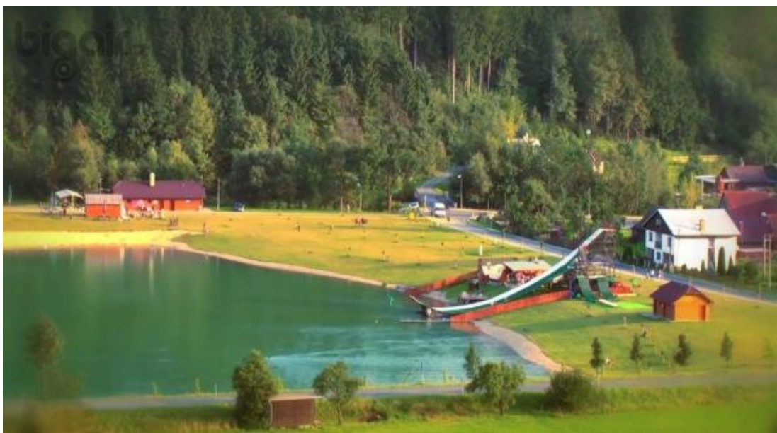
Obr. č. 3 Areál Na Stanoch

V městyse se nachází několik sportovních klubů a organizací např.: SDH Nový Hrozenkov, HC Nový Hrozenkov, Sokol Nový Hrozenkov – fotbal club, BigAir – freestylové skoky do vody na snowboardu a lyžích, Jezdecká stáj Utah, Vzpěračský oddíl TJ Sokol Nový Hrozenkov, Maxrider bike team, Orel jednota Nový Hrozenkov. Další sportovní zázemí se nacházejí v lyžařských areálech Vranča a Kohútka, návštěvníci mohou využívat sjezdovky různých obtížností, lyžařskou školu, půjčovnu lyží nebo třeba snowpark.