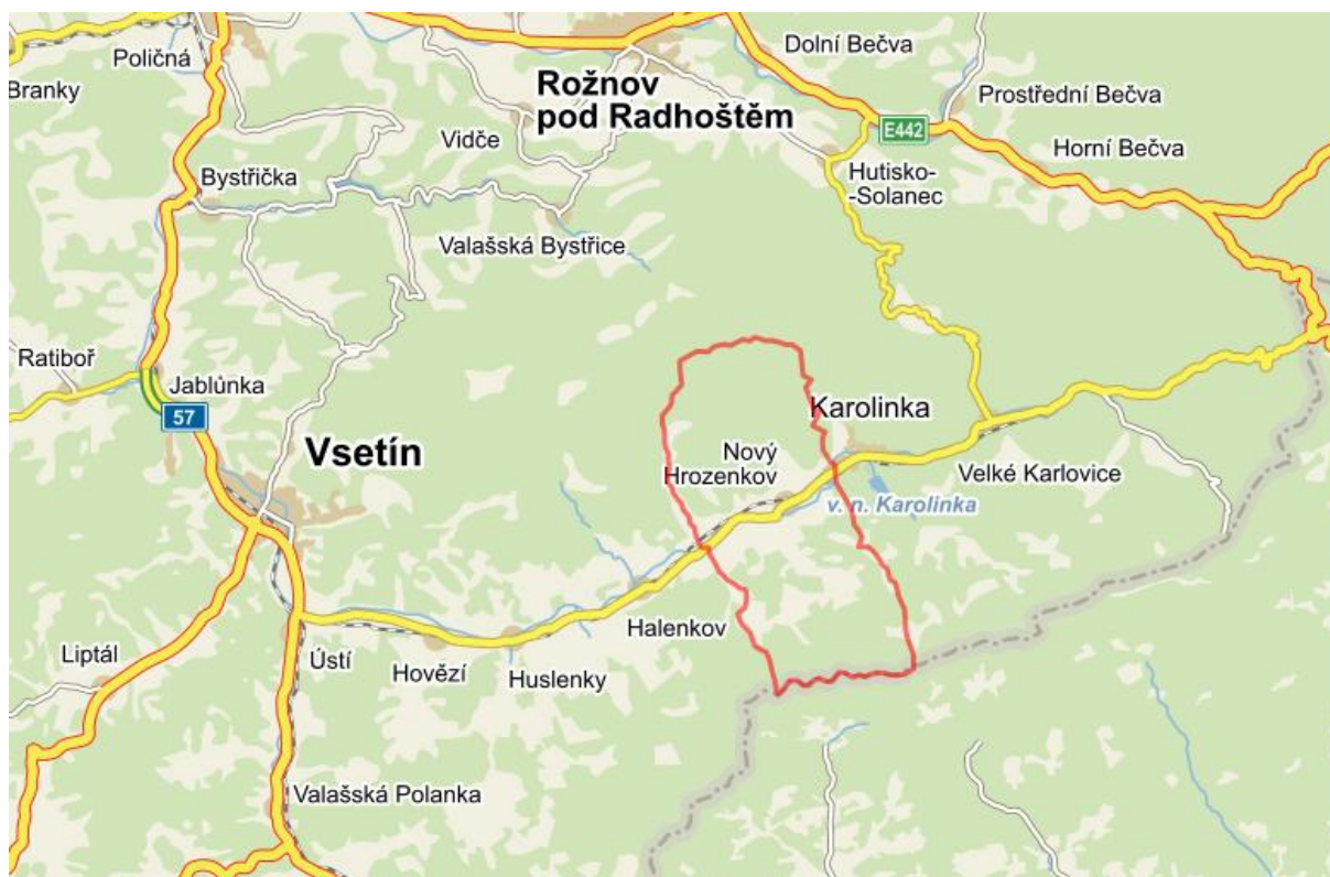
Obr. č. 1 Katastrální území městyse Nový Hrozenkov

Městys Nový Hrozenkov je vzdálen 20 km od města Vsetína a 31 km od města Rožnov pod Radhoštěm. Leží na hlavní silniční tepně vedoucí na Slovenské hranice. Katastrální území městyse sousedí s městem Karolinka, obcí Halenkov, obcí Valašská Bystřice a státními hranicemi Slovenské republiky.