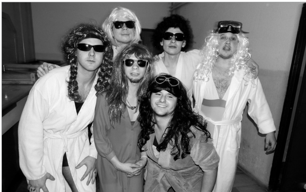
Sličné akvabely předvedly na maškarním plese pro dospělé dokonale synchronizovanou sestavu.