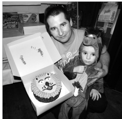
Děti s nejlepšími maskami dostaly od hasičů výborné dorty.

ní, kteří si přišli užít hlavně zábavu a soutěže. Hasiči byli opět vzorně připraveni a pod režijní taktovkou osvědčeného moderátora Luboše Oravce zapojovali do hrátek o ceny nejen děti, ale mnohdy i rodiče. Nechyběla bohatá tombola a dobrá hudba, kterou vybíral DJ Jirka Buček. Letos bylo sladkým dortem oceněno hned devět krásných masek a dítě s nejlepším převlekem dostalo hodnotnou věcnou cenu. Ale ani ostatní holky a kluci nemuseli být smutní. Všechny děti si