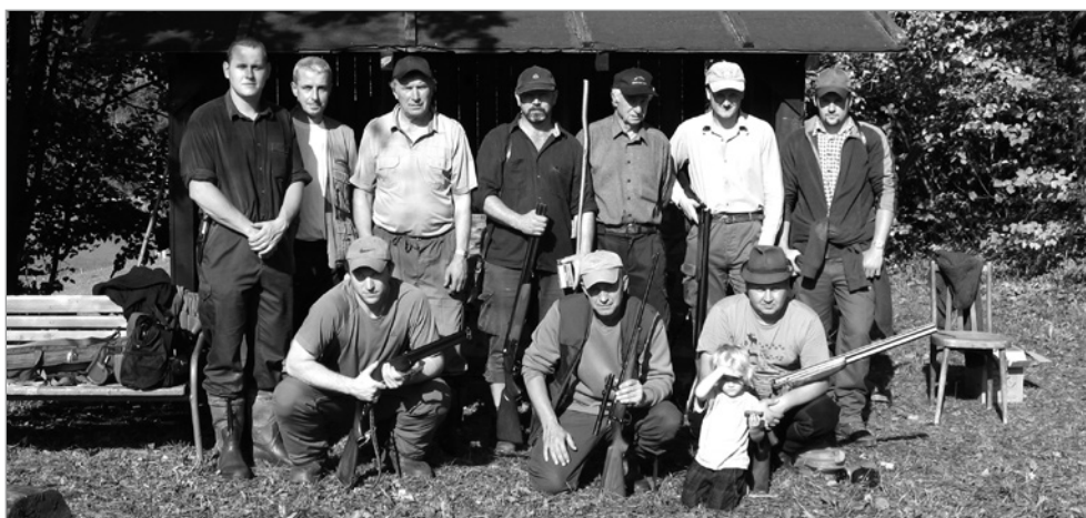
Účastníci soutěže ve střelbě na čubovské střelnici.