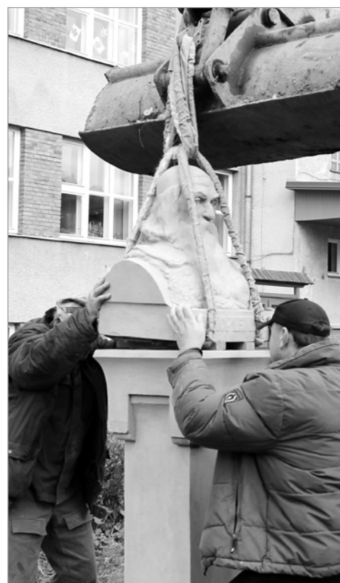
Po náročné rekonstrukci se busta vrátila opět na své místo.

desítky účinkujících žáků a žákyň školy, kteří odvedli profesionální výkon. I ti nejmladší zvládli na výbornou premiéru představení.