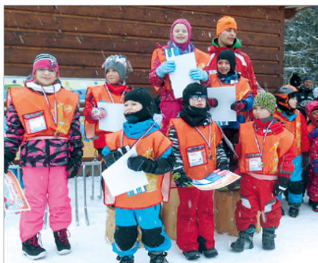
Děti z mateřinky Střed si užily na lyžařském výcviku i své první závody.

Máme velkou radost z toho, že se rodičům i dětem lyžařský kurz líbil a už teď pře-