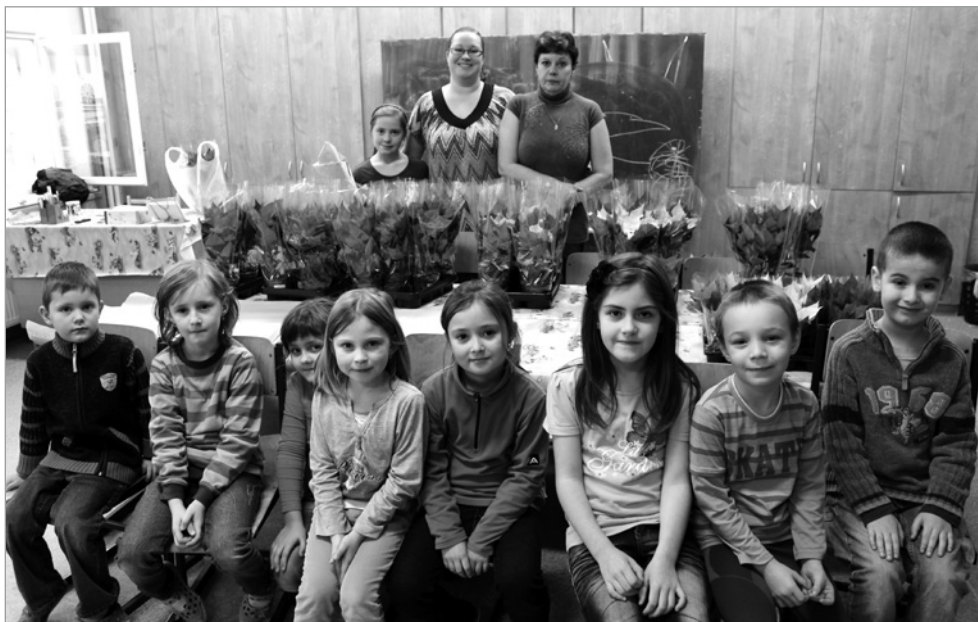
Výtěžek z prodeje vánoční hvězdy pomůže onkologicky nemocným.