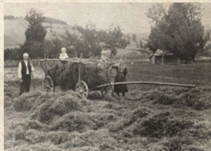
Sklizeň sena na žebříňáku v Novém Hrozenkově – Závoď, kolem roku 1925.

Koně vlastnili jen zámožnější hospodáři a byli využíváni při všech domácích tažných pracích a v zimě též k dovážení dřeva z lesů. Zapřahali se do chomoutů s kšíry. Krávy byly chovány nejen pro mléko pro potřebu domácností, ale byly rovněž využívány k potahu a zapřahaly se do jařma nebo jařmic. Vepřový dobytek je označován názvem „ušípané“ a byl chován zejména pro sádlo a maso, zatímco ovce hlavně pro vlnu, která