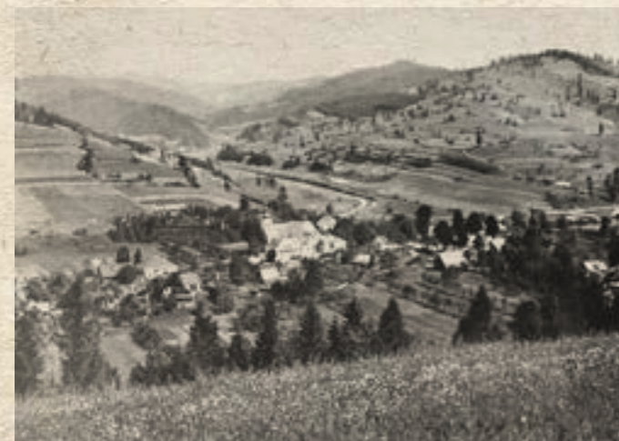
Střed Nového Hrozenkova s pohledem na nezastavěné údolí Brodská, odlesněné svahy jsou dokladem hospodaření ve vyšších polohách, kolem roku 1925.

V tomto období měla obec asi 3000 obyvatel a 400 domů. Až na několik německy psaných pozůstalostí jsou psány český kurentem. Poskytují nám svědectví zejména o hmotných a sociálních poměrech zdejších obyvatel. Není možné je pokládat za zcela přesné zrcadlo majetkových poměrů jednotlivých občanů. Odrážejí však sociální rozvrstvení obyvatel obce od majetných, až po usedlíky zcela nemajetné, kteří se živili nádenickou prací (vysloužili vojáci), nebo žebrotou.