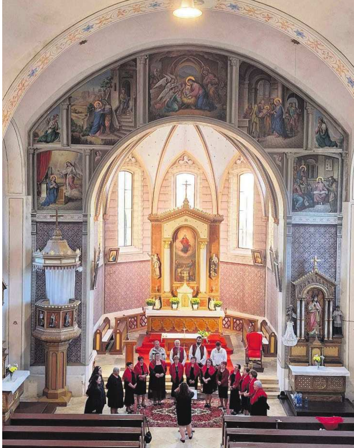
Hafera v kostele Nanebevzetí Panny Marie ve Stašově.