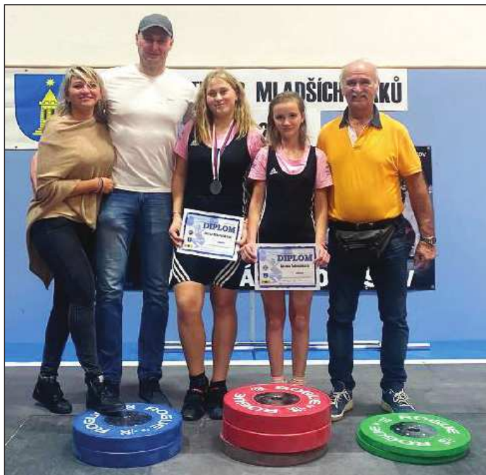
Rodiče s Eliškou, Zuzanka a trenér.