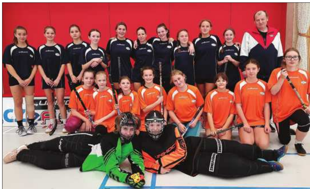
Žákovský výběr reprezentace mladších a starších dívek ZŠ Nový Hrozenkov.