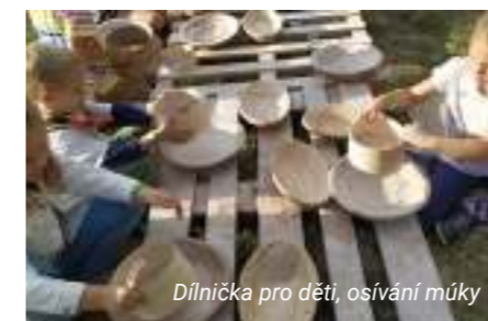
Dílňička pro děti, osívání múky

a drahých kamelech využívaných ve zlatnictví, zejména pak o jejich zpracování tradičními zlatnickými výrobními a výzdobnými technikami. Tyto postupy jsou tu zdokumentovány i prostřednictvím krátkých videí. Na výstavě můžete nahlédnout do dílny zlatníka vybavené autentickým zlatnickým stolem a nářadím. K vidění jsou rozmanitými zlatnickými postupy zhotovené historické předměty, například