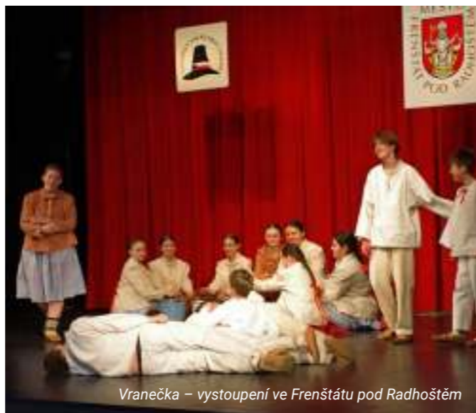
Vranečka – vystoupení ve Frenštátu pod Radhoštěm