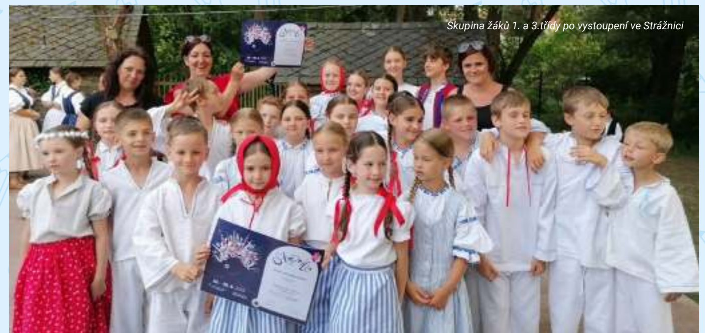
Skupina žáků 1. a 3. třídy po vystoupení ve Strážnici