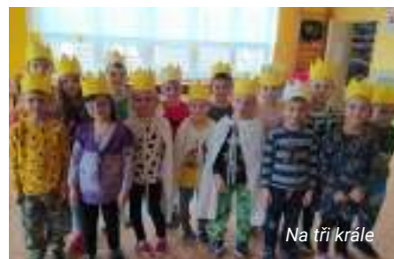
Na tři krále