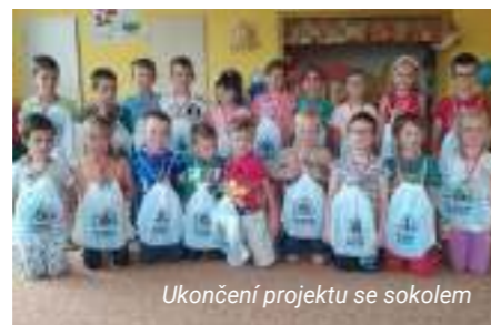
Ukončení projektu se sokolem