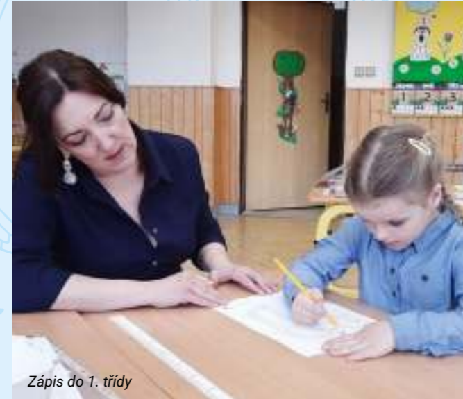
Zápis do 1. třídy