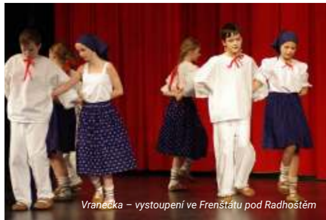
Vranečka – vystoupení ve Frenštátu pod Radhoštěm