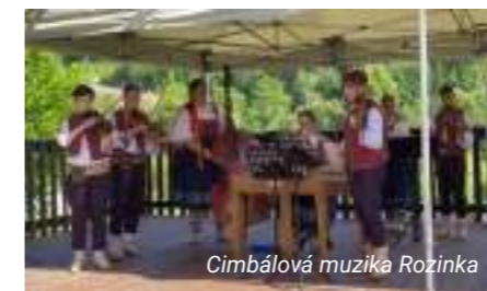
Cimbálová muzika Rozinka