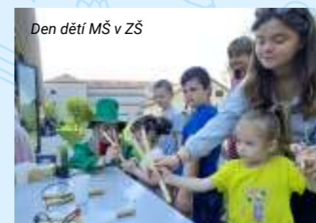
Den dětí MŠ v ZŠ