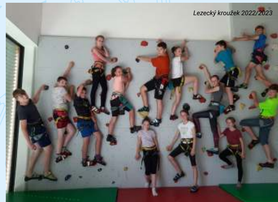
Lezecký kroužek 2022/2023