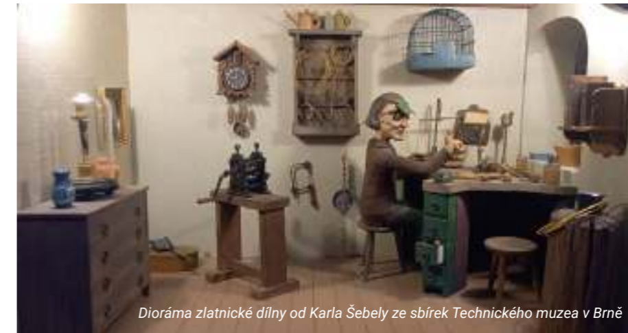
Dioráma zlatnické dílny od Karla Šebely ze sbírek Technického muzea v Brně

Ve výstavní síni Maštal je až do 31. října instalovaná naučná výstava Technického muzea v Brně o zlatnictví a příbuzných kovozpracujících oborech nazvaná Zlaté řemeslo. Dozvíte se zde spoustu zajímavostí o kovech