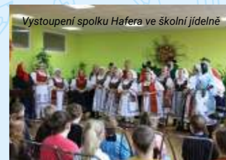
Vystoupení spolku Hafera ve školní jídelně