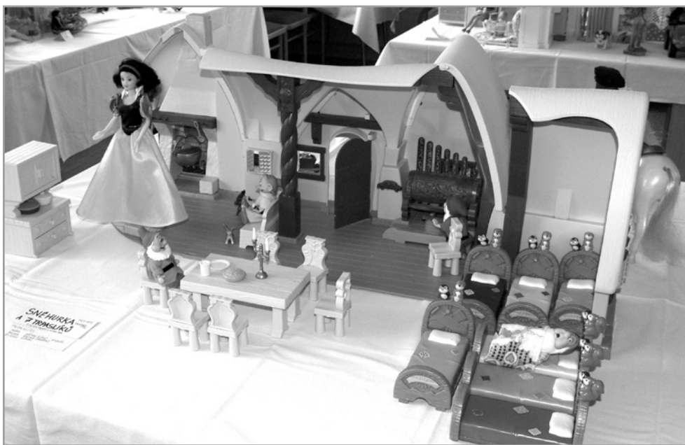
Postavičky z pohádky Sněhurka a sedm trpaslíků.