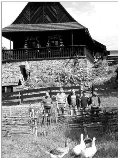
Výstavu drobného zvířectva připravili místní chovatelé.

Na louce pod areálem Památníku Antonína Strnadla připravili malou výstavu hrozenkovští chovatelé. V důmyslné ohradě z proutí se proměňovala vodní drůbež, v klecích se zase naparovali poštovní i okrasní holubi a nejrůznější plemena králíků, slepic, perliček a krůt. Miláčkem nejmenších se stal francouzský beran, ovšem rohy a kopytka byste