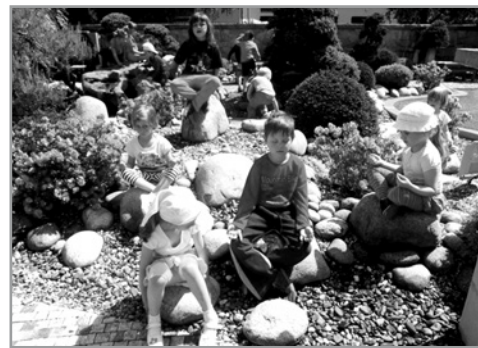
Také děti ze třídy Sluníčka chodí do zahrady načerpat síly a medítovat.

V japonské zahradě, jak již bylo řečeno, má svoji symboliku všechno. Počet rostlin je liché číslo. Vyjadřuje princip vývoje, pohybu, neukončenosti ve smyslu směřování k dokonalosti. Naproti tomu sudý počet představuje princip ukončeného vývoje bez pohybu. U brány do zahrady je takzvaný vítací strom. Borovice, jejíž jedna z nejnižších položených větví je pěstována jakoby podávala návštěvníkům ruku a směřuje nad bránu. Tento pro zahradu významný strom byl vybrán podle tvaru a velikosti v německém zahradnictví Brüns.