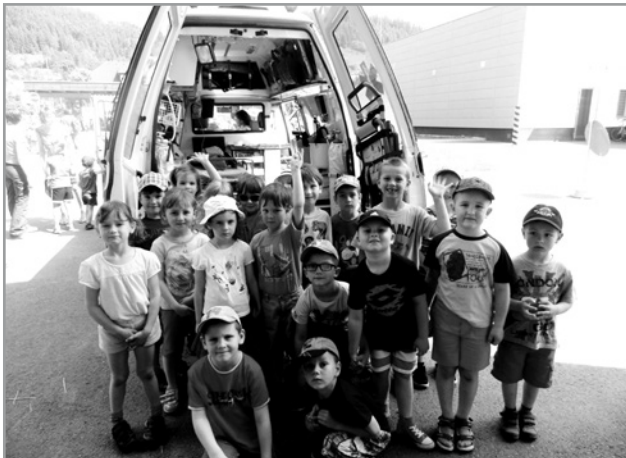
Prozkoumat záchranné auto děti bavilo.

Závěr školního roku patřil v hrozenkovské mateřince samým zajímavým akcím. Patřila k nim bezesporu i návštěva stanice integrovaného záchranného systému v Karolině. Téměř každý rok do naší MŠ zajíždí policisté z Karolinky, letos jsme byli pozváni my k nim.