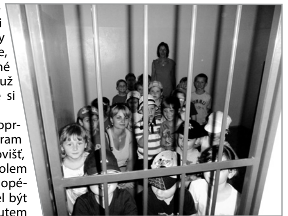
Děti i paní učitelky skončily na chvíli za mřížemi.

láky zase paní učitelky vzaly na film ve 3D do vsetínského kina.