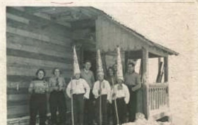
Pastýři před chatou Kohútka, r. 1933