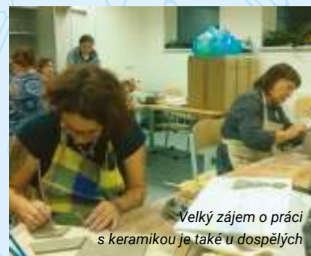
Velký zájem o práci s keramikou je také u dospělých