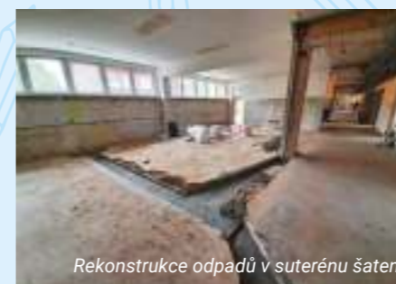
Rekonstrukce odpadů v suterénu šaten