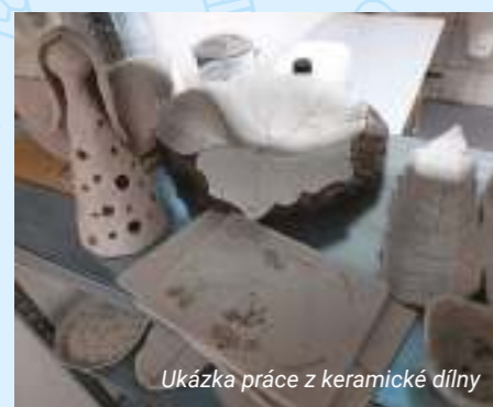
Ukázka práce z keramické dílny