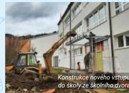
Konstrukce nového vstupu do školy ze školního dvora

bude v této době bez možnosti připojení k elektřině a mimo provoz bude ze stejného důvodu vytápění budovy školy. Z provozně technických důvodů bylo vyhlášeno ředitelské volno. Práce budou pokračovat i mezi svátky a naplno opět i lednu, kdy v závěru měsíce plánujeme instalovat nové šatní skříňky pro žáky školy. Pokud se vše podaří, pak se můžeme těšit na otevření šaten v únoru 2022.