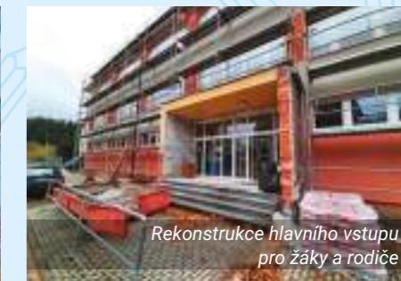
Rekonstrukce hlavního vstupu pro žáky a rodiče