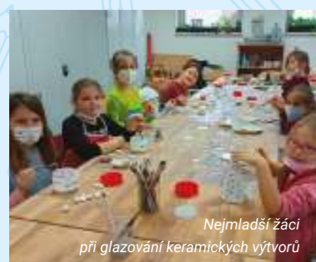
Nejmladší žáci při glazování keramických výtvořů