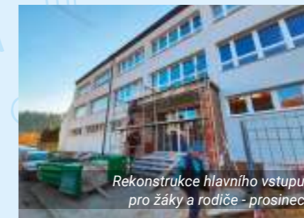
Rekonstrukce hlavního vstupu pro žáky a rodiče - prosinec