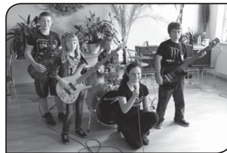
Foto: Kapela Prasklá struna se na konci školního roku představila žákům školy.

Rád bych oslovil všechny, kteří se chtějí podílet na dalších aktivitách nejen