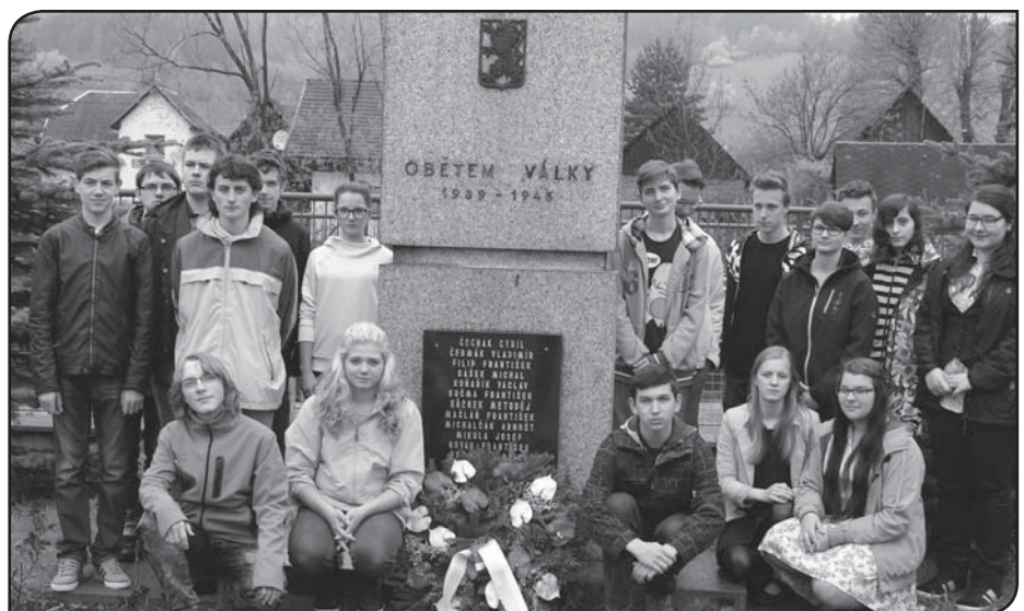
Foto: Žáci uctili památku obětí války pietním aktem a položením věnce.