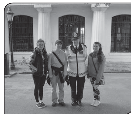
Foto: Exkurze do Londýna umožnila našim žákům prověřit jazykové znalosti a zažít na vlastní kůži jinou kulturu a zvyky cizí země.

Velké poděkování patří našim žákům za vzorné a bezproblémové chování. Díky si zaslouží kolegové za přípravu, realizaci a volný čas strávený s dětmi mimo školu.