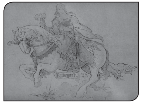
Foto: Takto zpodobnil Mikoláš Aleš boha Radegasta.