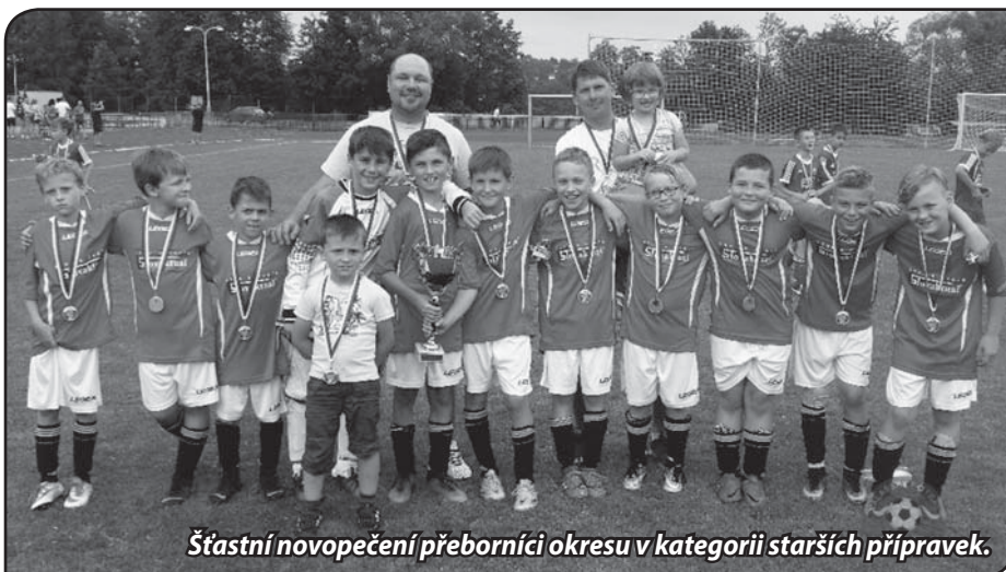
Šťastní novopečení přeborníci okresu v kategorii starších přípravek.