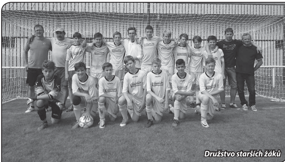
Družstvo starších žáků