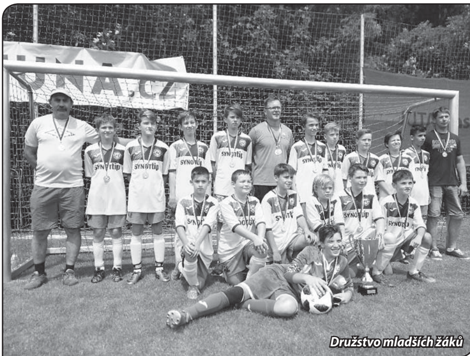
Družstvo mladších žáků